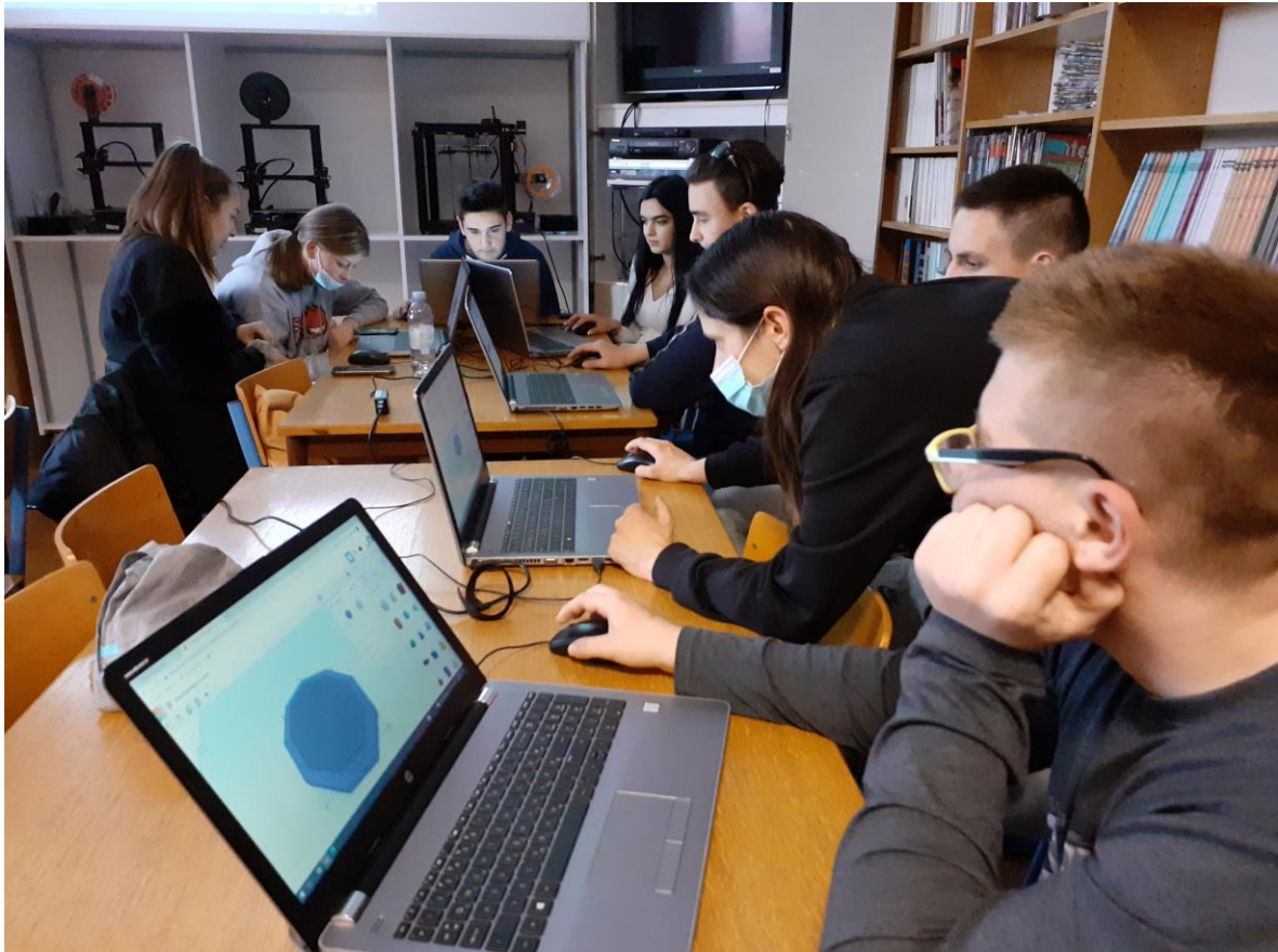
Slika 2 Modeliranje privjeska za Festival Znanosti 2022.